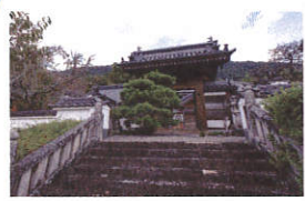
瑠璃光寺 金剛塗菩薩

〒771-2502 徳島県三好郡東みよし町足代2892 Tel.0883-79-2511