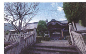
長樂寺 金剛嬉菩薩

〒779-4803 徳島県三好市井川町中岡34 Tel.0883-78-2054