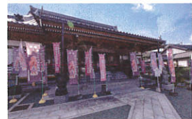
不動院 金剛蔓菩薩

〒779-4806 徳島県三好市井川町西井川600 Tel.0883-78-2917