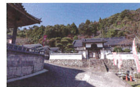
密厳寺 金剛燈菩薩

〒778-0040 徳島県三好市池田町西山佐古3798 Tel.0883-72-1548