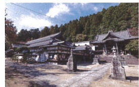
箸蔵寺 金剛歌菩薩

〒778-0020 徳島県三好市池田町州津蔵谷1006 Tel.0883-72-0812