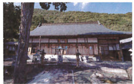
願成寺 金剛舞菩薩

〒771-2501 徳島県三好郡東みよし町屋間3004 Tel.0883-79-2269