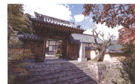
蓮華寺 金剛華菩薩

〒778-0011 徳島県三好市池田町ハヤシ1209 Tel.0883-72-0232